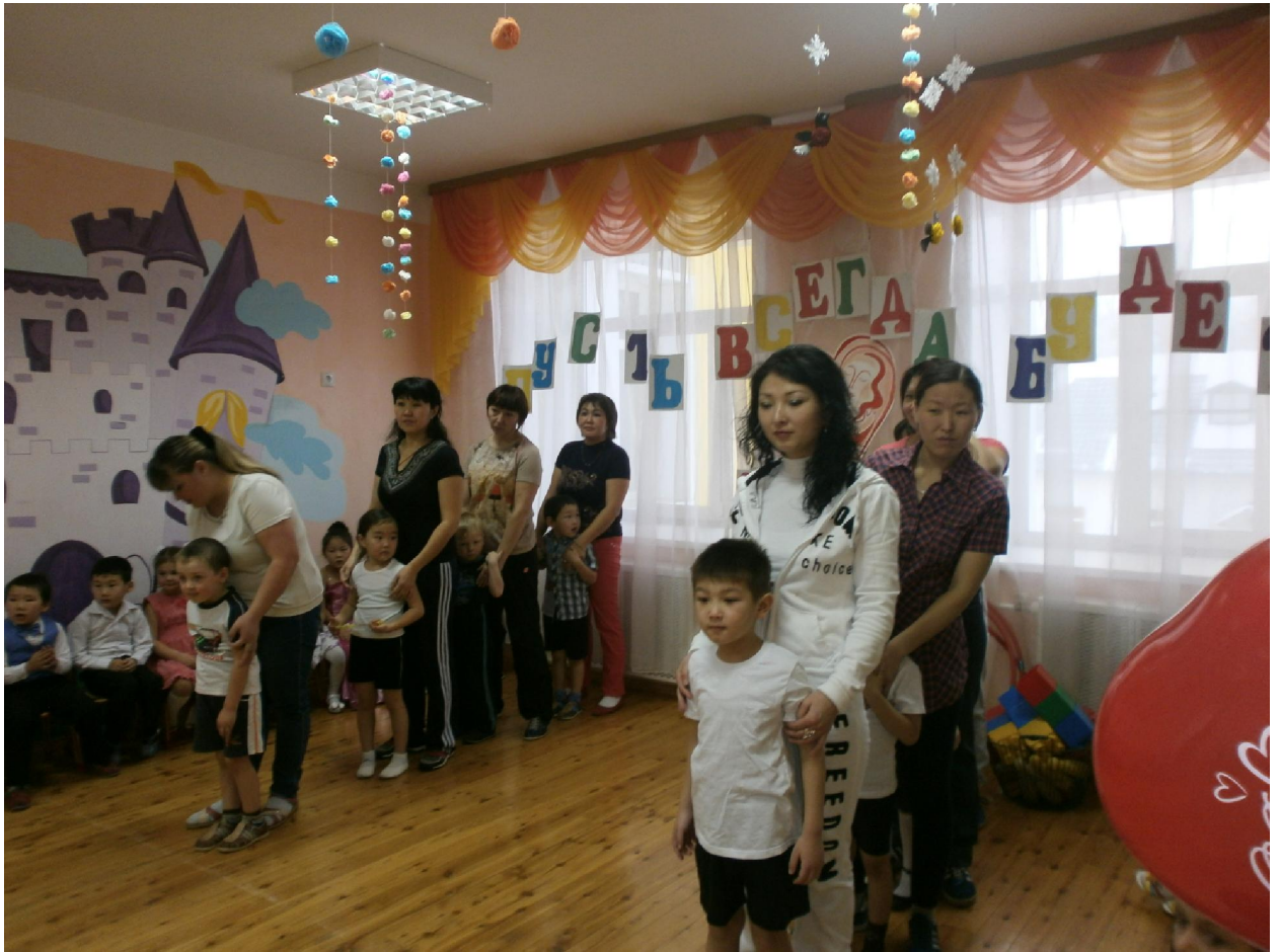
Две группы. Мамы с детьми соревнуются!