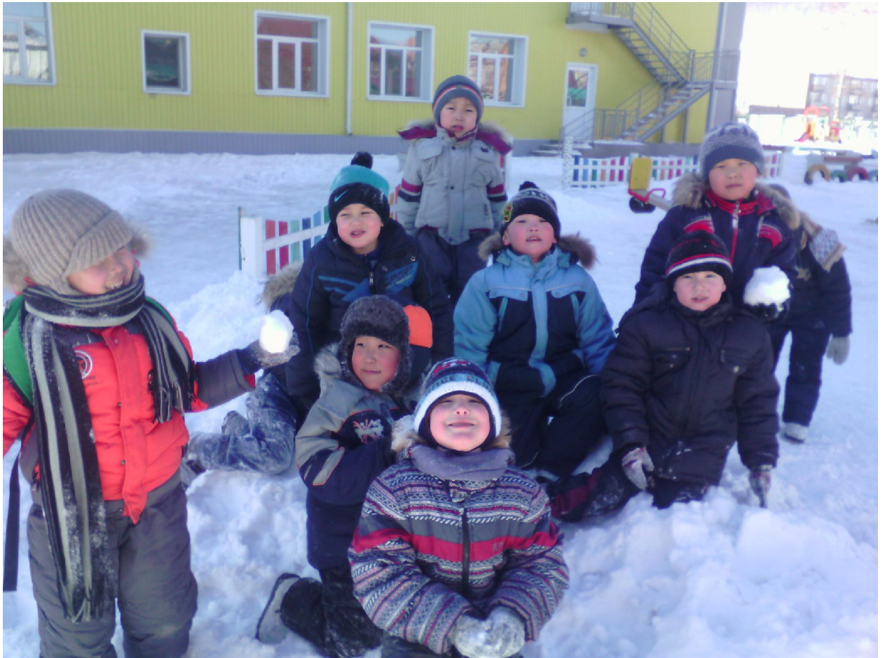
Нам нравится играть в снежки.