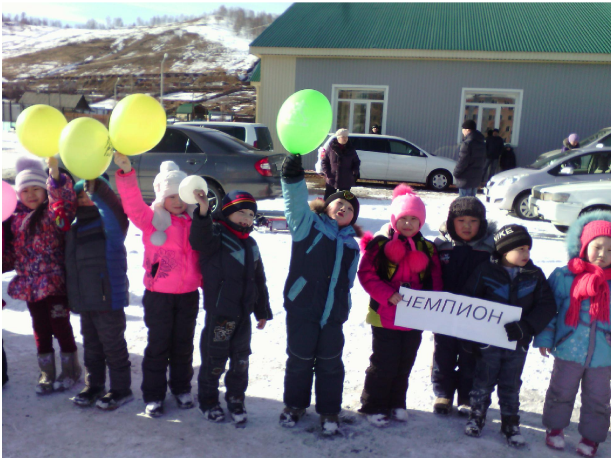
ЛЮБИМ СПОРТОМ ЗАНИМАТЬСЯ НАША ГРУППА-КОМАНДА "Чемпион" НА СОРЕВНОВАНИЯХ МЕЖДУ САДАМИ ГОРОДА ЗАНЯЛА 3 МЕСТО! ура-ура -ура!