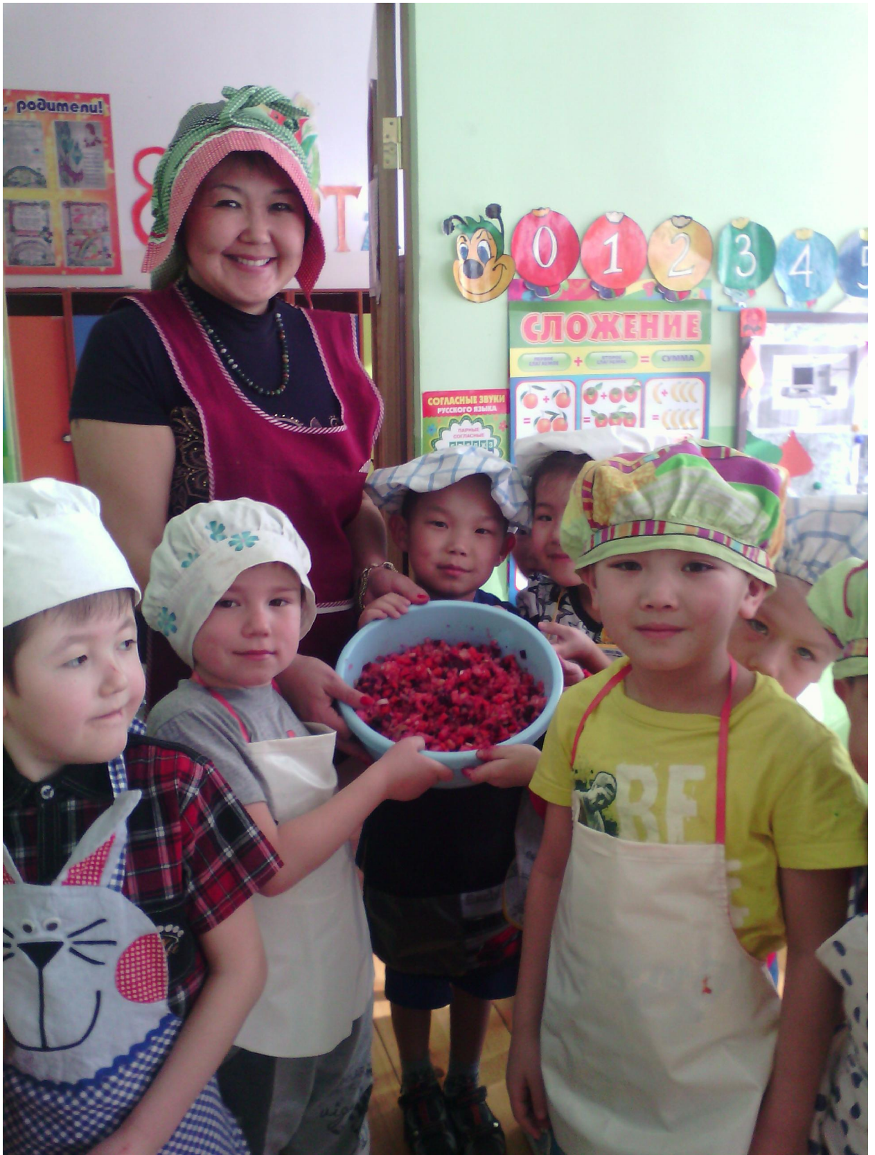
А еще мы любим готовить. Сами сделали салат "Винегрет"