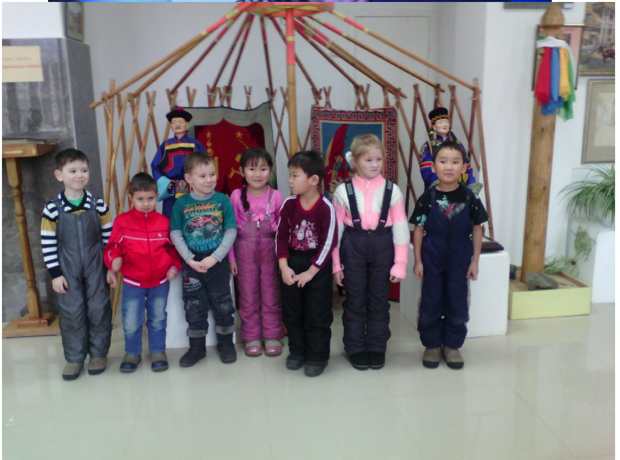
Очень нам нравятся экскурсии! Это мы в музее.