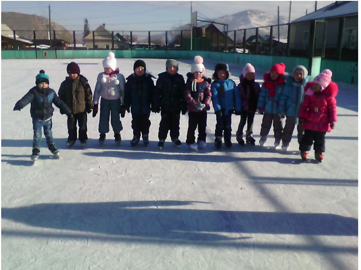
и кататься на коньках мы почти все умеем . На нашем стадионе "Металлург"