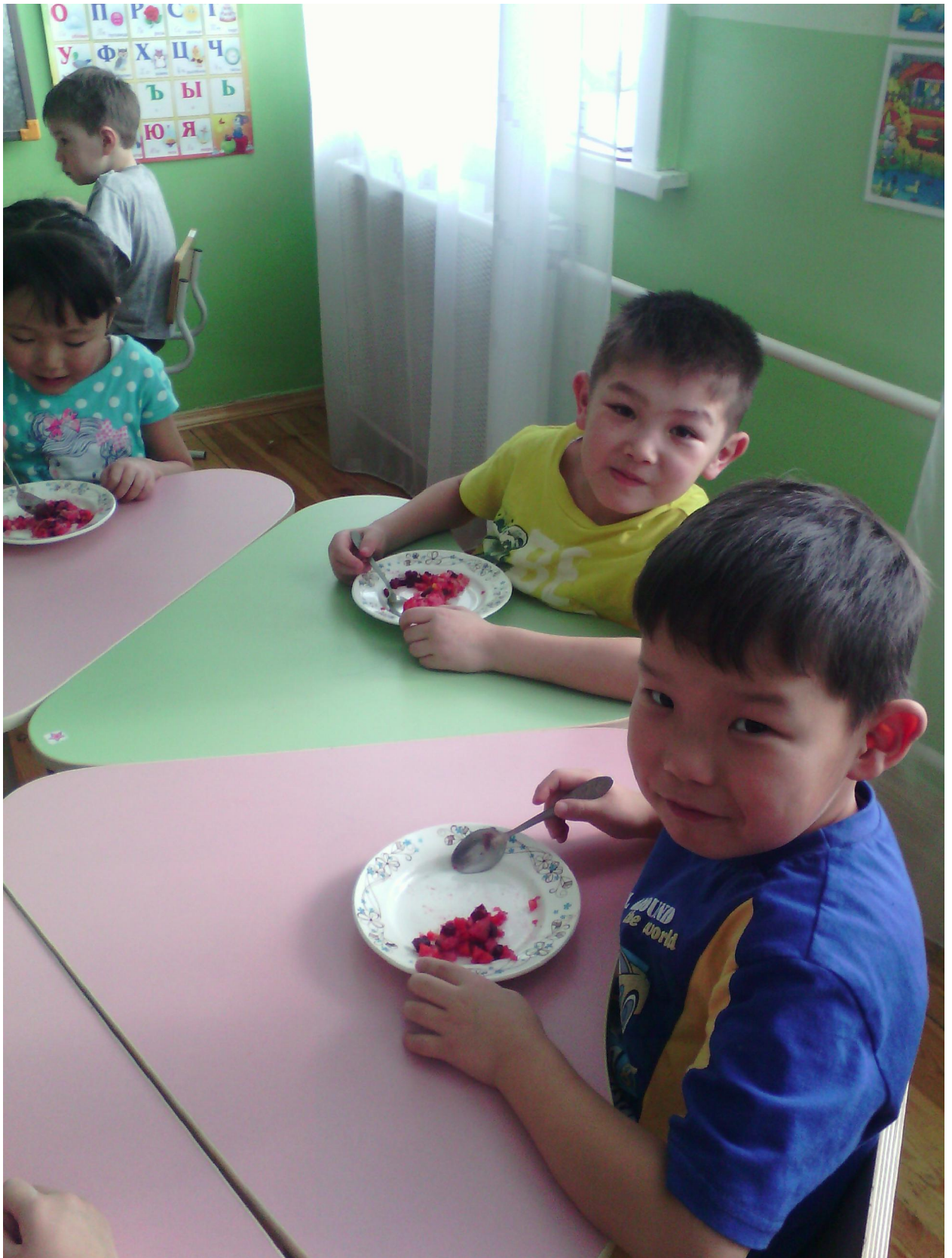
Сами приготовили и сами съедем! Да еще и угостили. Вас угостим заходите к нам на чай!