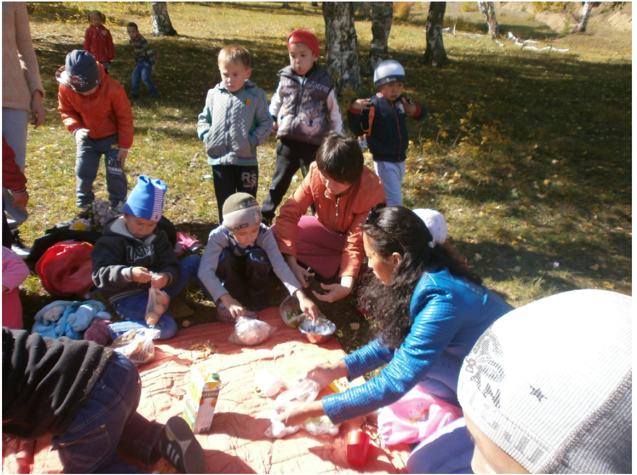
МЫ ХОДИЛИ В ПОХОД ! Сейчас мы вместе с мамами накрываем обед!