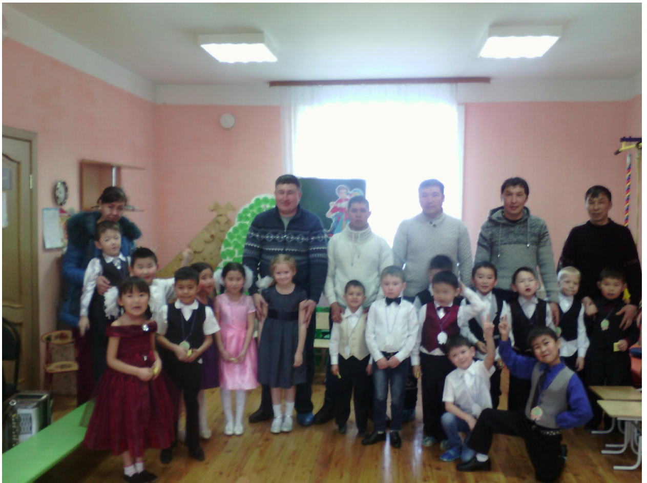
Это мы с нашими папами после концерта посвященному к 23 февраля!