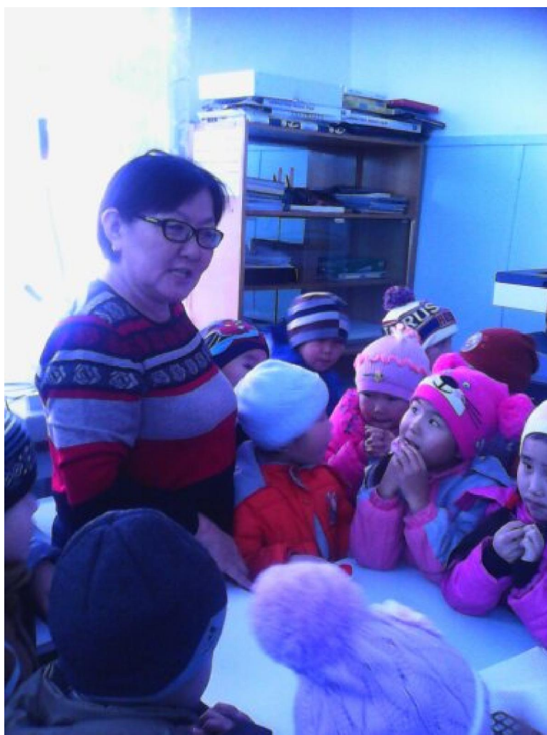
Экскурсия в типографию