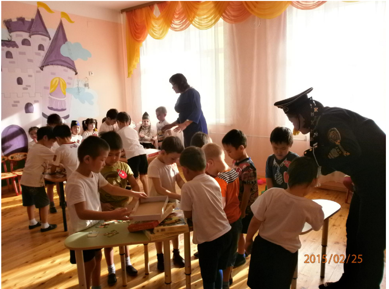
Утренник посвященный 23 февраля. Чья команда быстрее и правильно соберет пазлы.